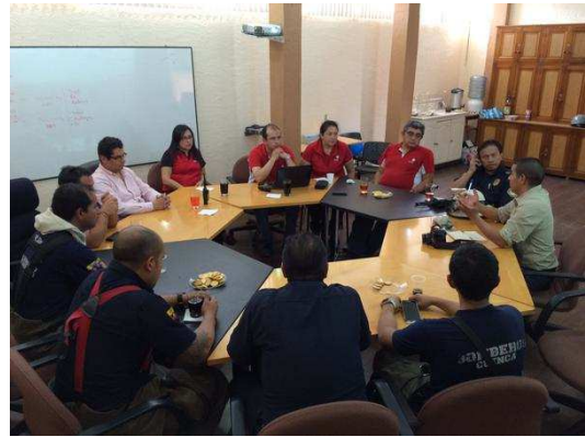
Evaluación del simulacro