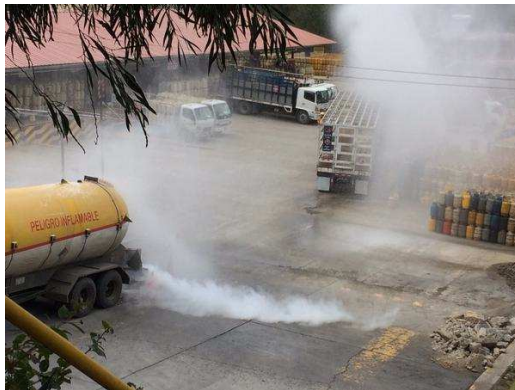
Fuga de GLP en un Autotanque