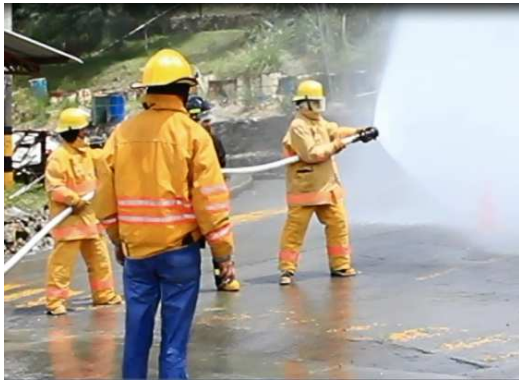
Brigada Contra Incendios Austrogas atacando la emergencia