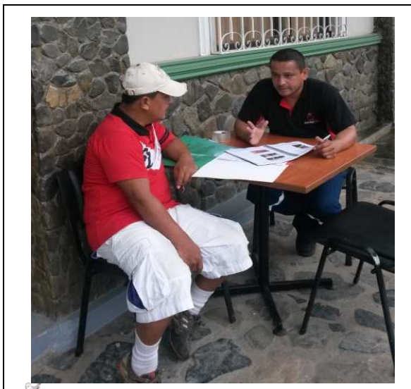
Mesa Informativa en Montalvo

Se han implementado mecanismos de participación ciudadana para la gestión institucional a través del proceso de participación social para la obtención de la Licencia Ambiental como Comercializadora con énfasis en el Plan de Contingencia tanto en la Planta Cuenca, como en la de Ventanas.