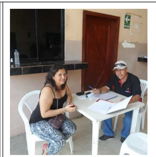
Mesa Informativa El Empalme