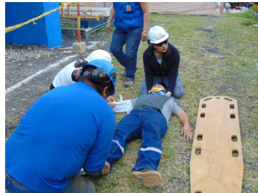
Brigada de Primeros Auxilios brindando atención a los heridos