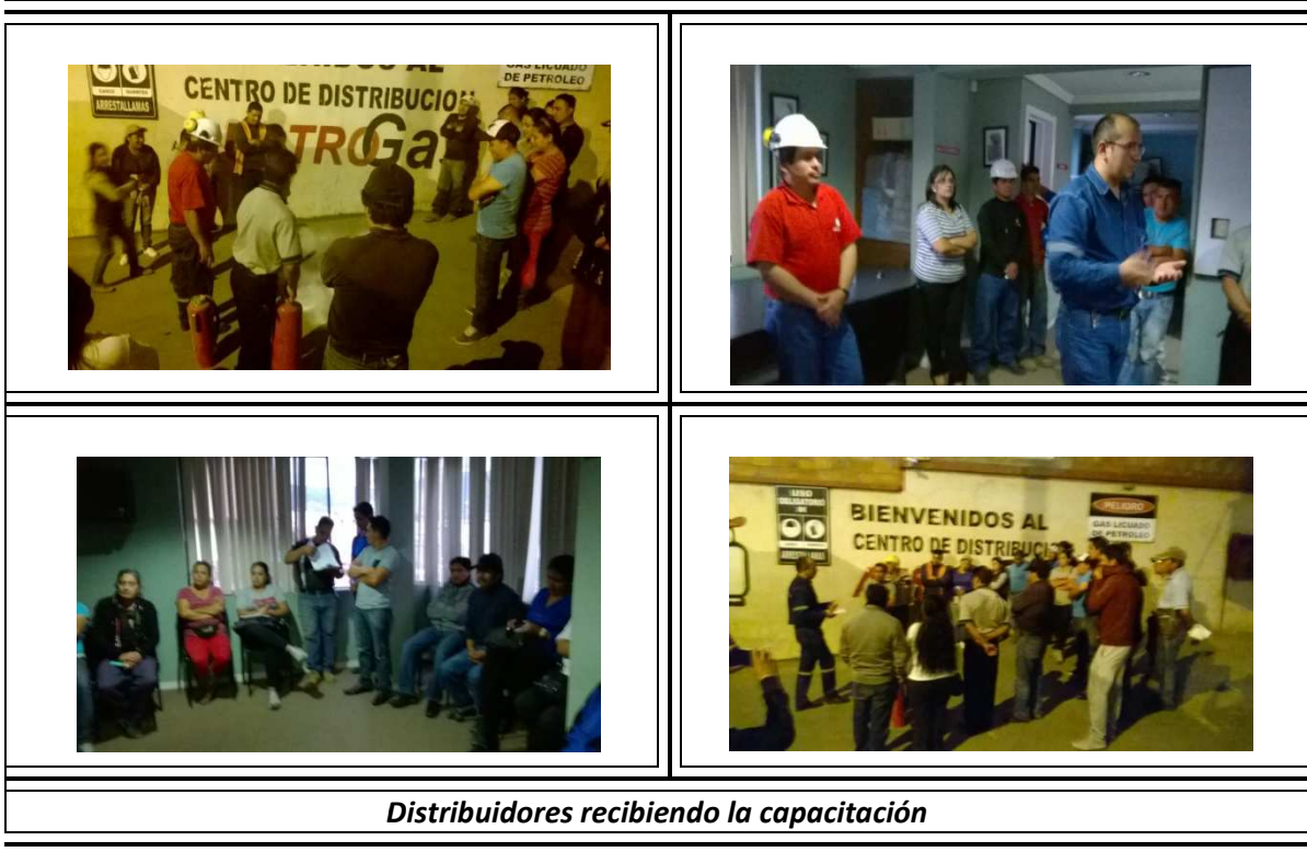
Distribuidores recibiendo la capacitación